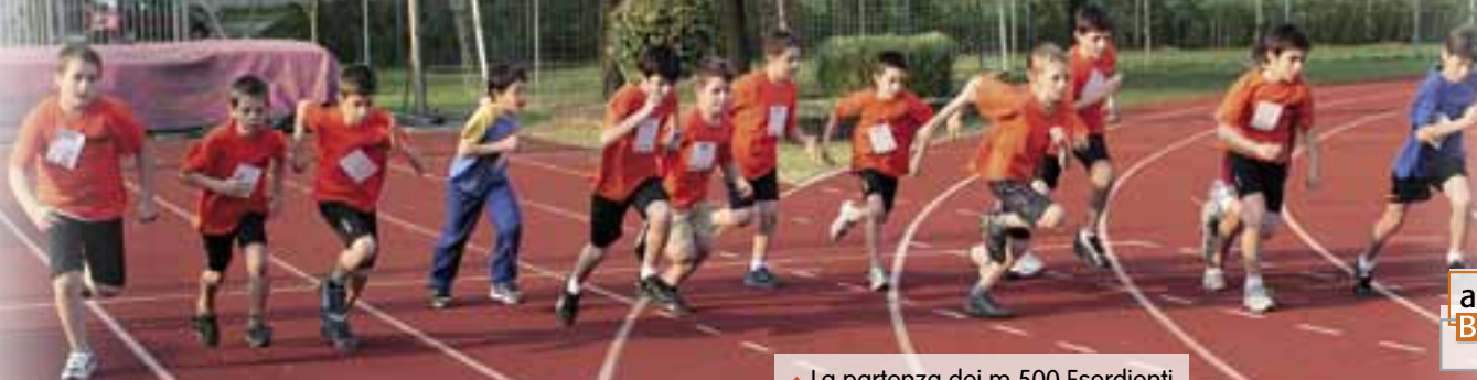
▲ La partenza dei m 500 Esordienti.