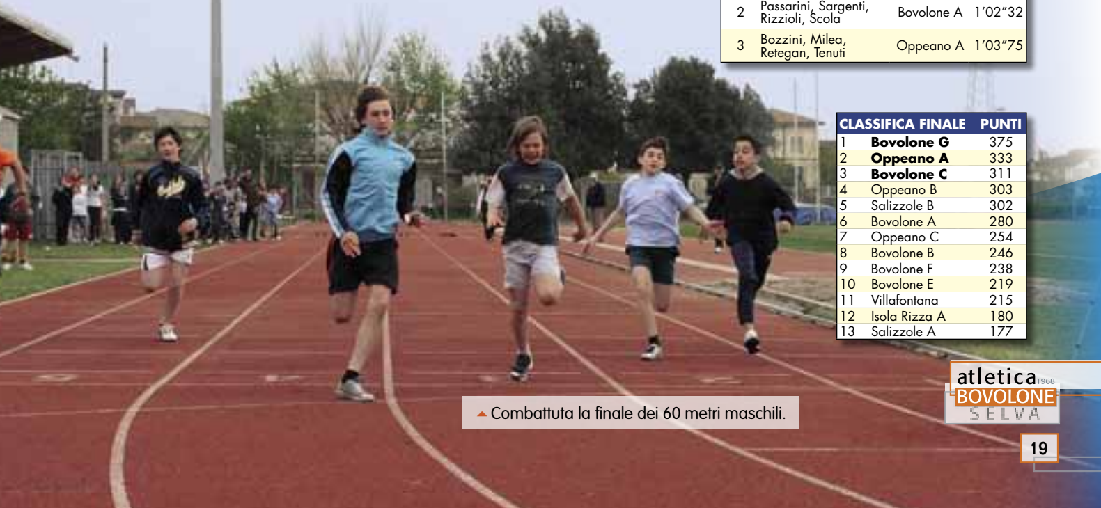
▲ Combattuta la finale dei 60 metri maschili.