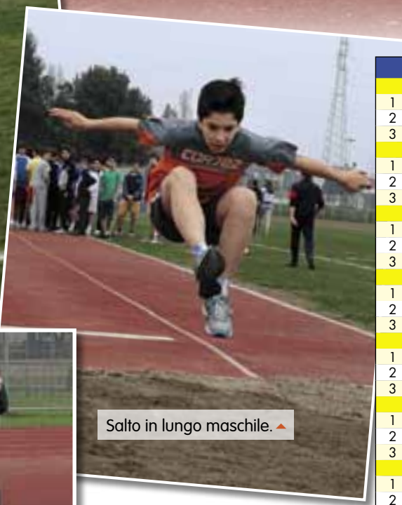
Salto in lungo maschile. ▲