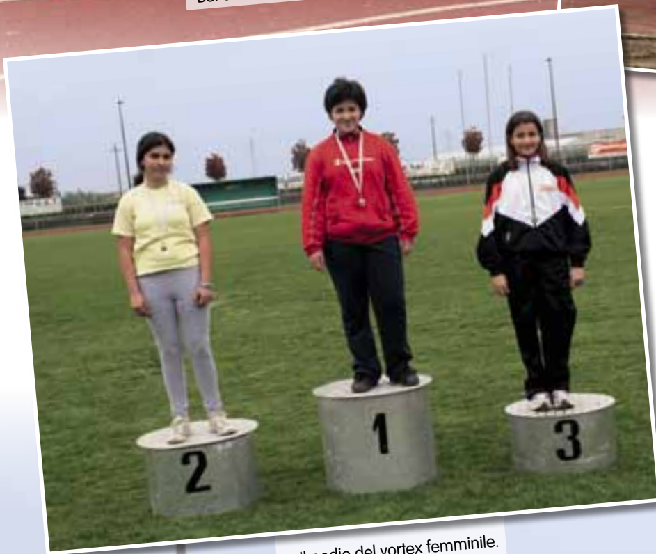
▲ Il podio del vortex femminile.