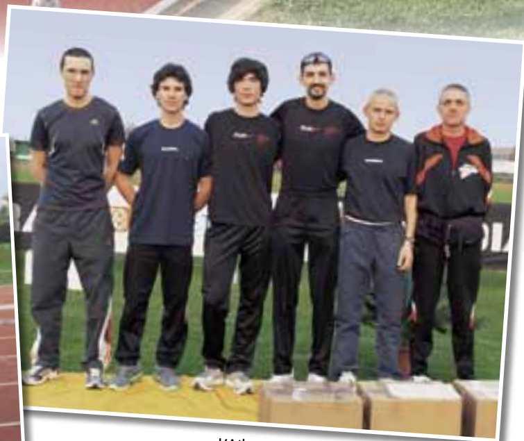
▲ L'Atletica Selva Bovolone "A".