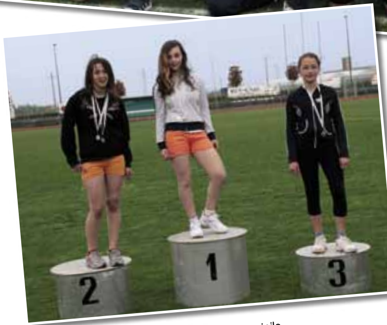
▲ Il podio del cross femminile.