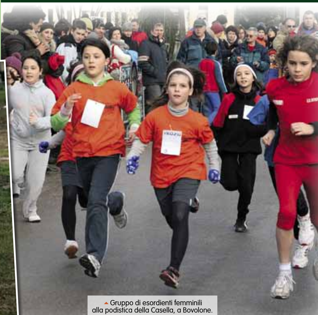
▲ Gruppo di esordienti femminili alla podistica della Casella, a Bovolone.