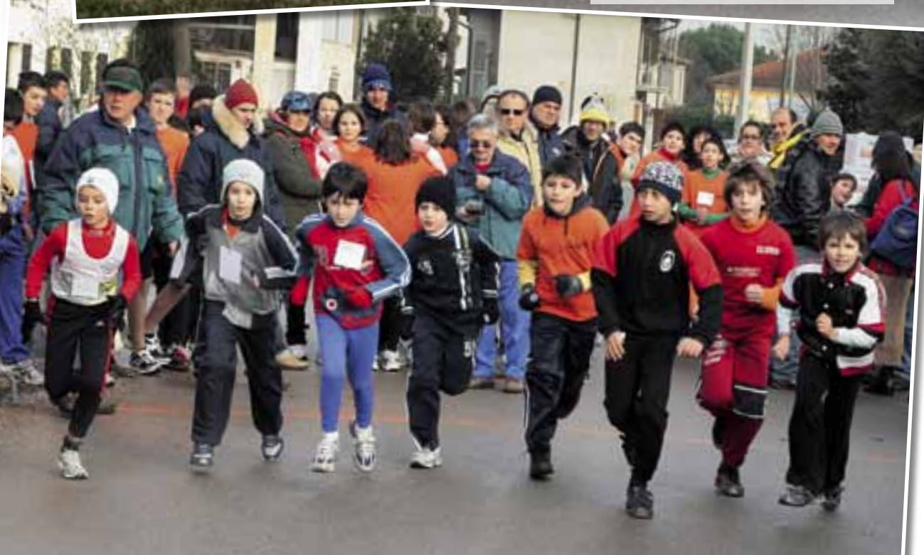
◀ La partenza degli esordienti maschili alla podistica della Casella.