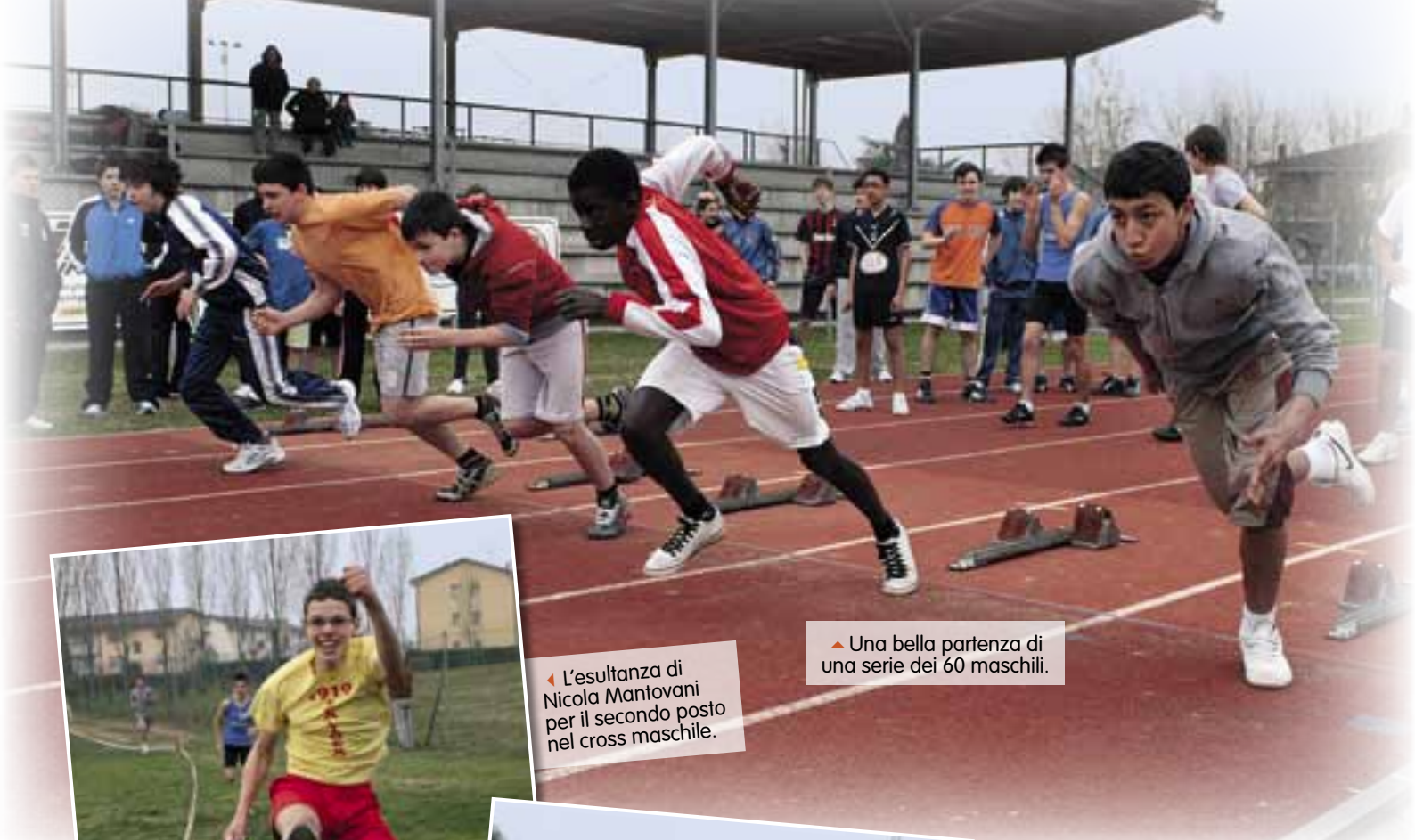
▲ Una bella partenza di una serie dei 60 maschili.