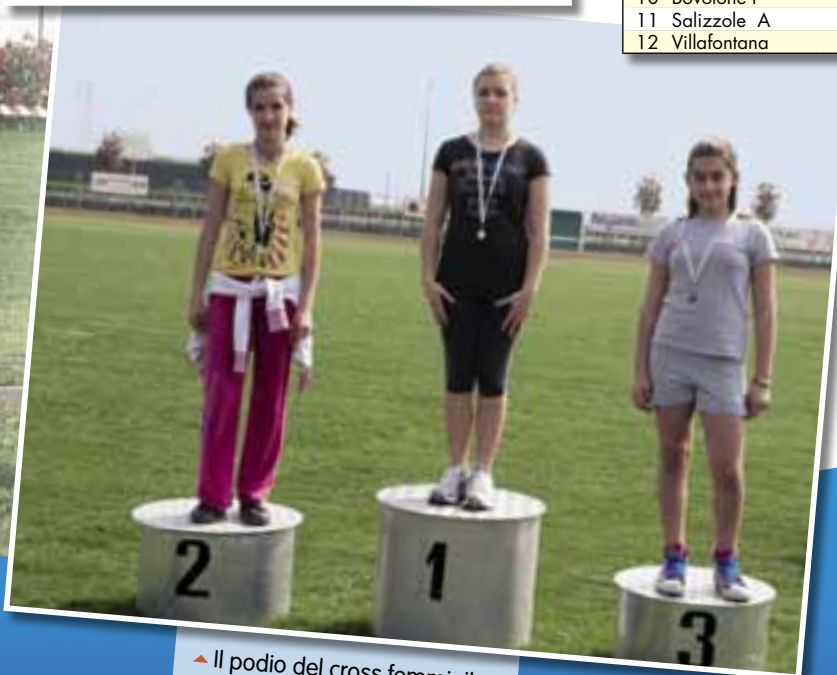
▲ Il podio del cross femminile.