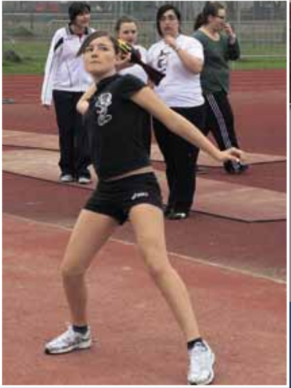
◀ Vortice femminile