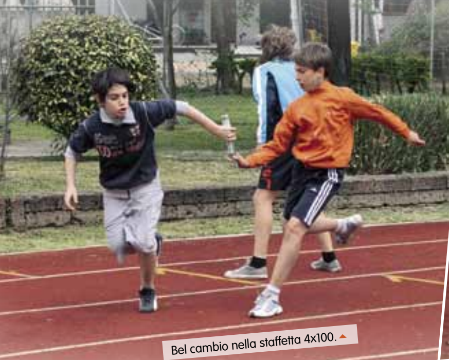
Bel cambio nella staffetta 4x100. ▲