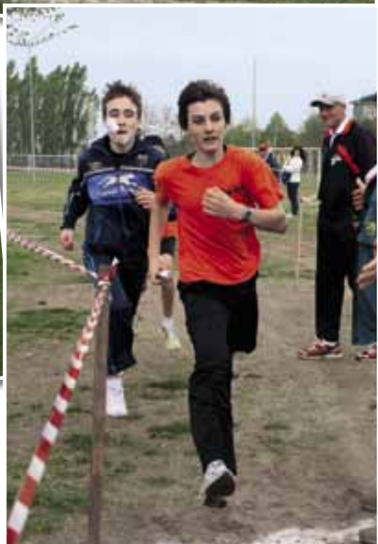
Bella gara nel cross maschile, risoltasi allo sprint finale. ▶